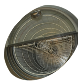
Indvendig ventilator og kurv